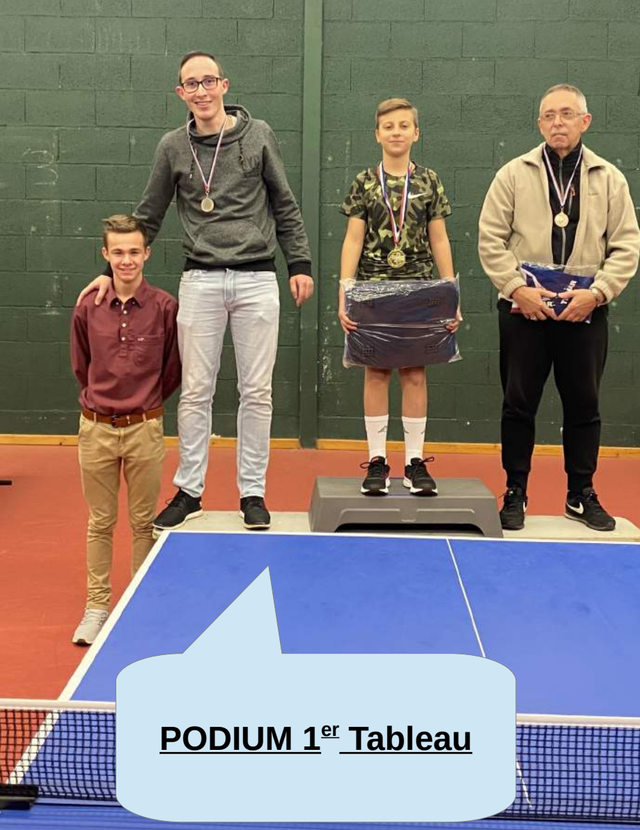
PODIUM 1 er Tableau